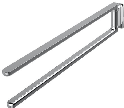
Immagine del prodotto

NIA Adesio Porta asciugamani 2bracci mobili 33.3cm Montaggio incollaggio o foratura incl. materiale di fissaggio (senza colla) Quantità riempimento adesivo: 1,2 ml SikaFast