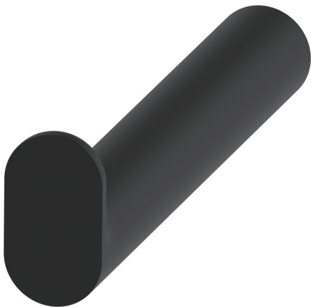
Immagine del prodotto