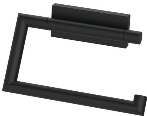
Immagine del prodotto

SIGNA portacarta con gancio aperto nero opaco, senza coperchio, montaggio sinistra/destra, Montaggio Adesivo per incollaggio o foratura, incl. materiale di fissaggio (senza adesivo), quantità riempimento adesivo: 1.1 ml SikaFast