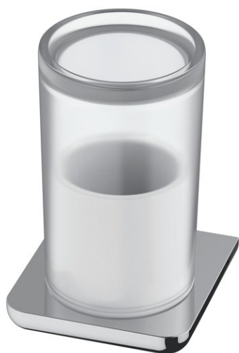
Immagine del prodotto