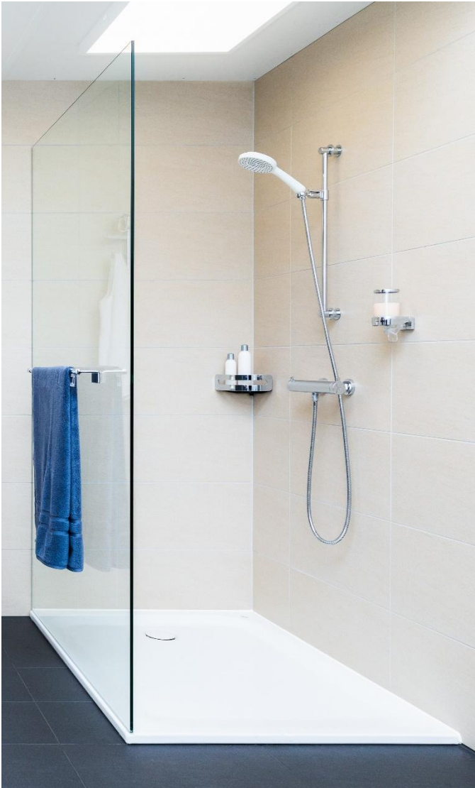
[Bild 3]: Alles geklebt: Dank der Klebmontage mit Adesio bleibt die Wandabdichtung vollständig intakt. Somit lässt sich die neue Norm SIA 271/1 auf einfache und flexible Weise erfüllen. Im Bild: Badezimmeraccessoires von Bodenschatz sowie Duschgleitstange KWC Fit mit Klebeadaptoren von Bodenschatz.