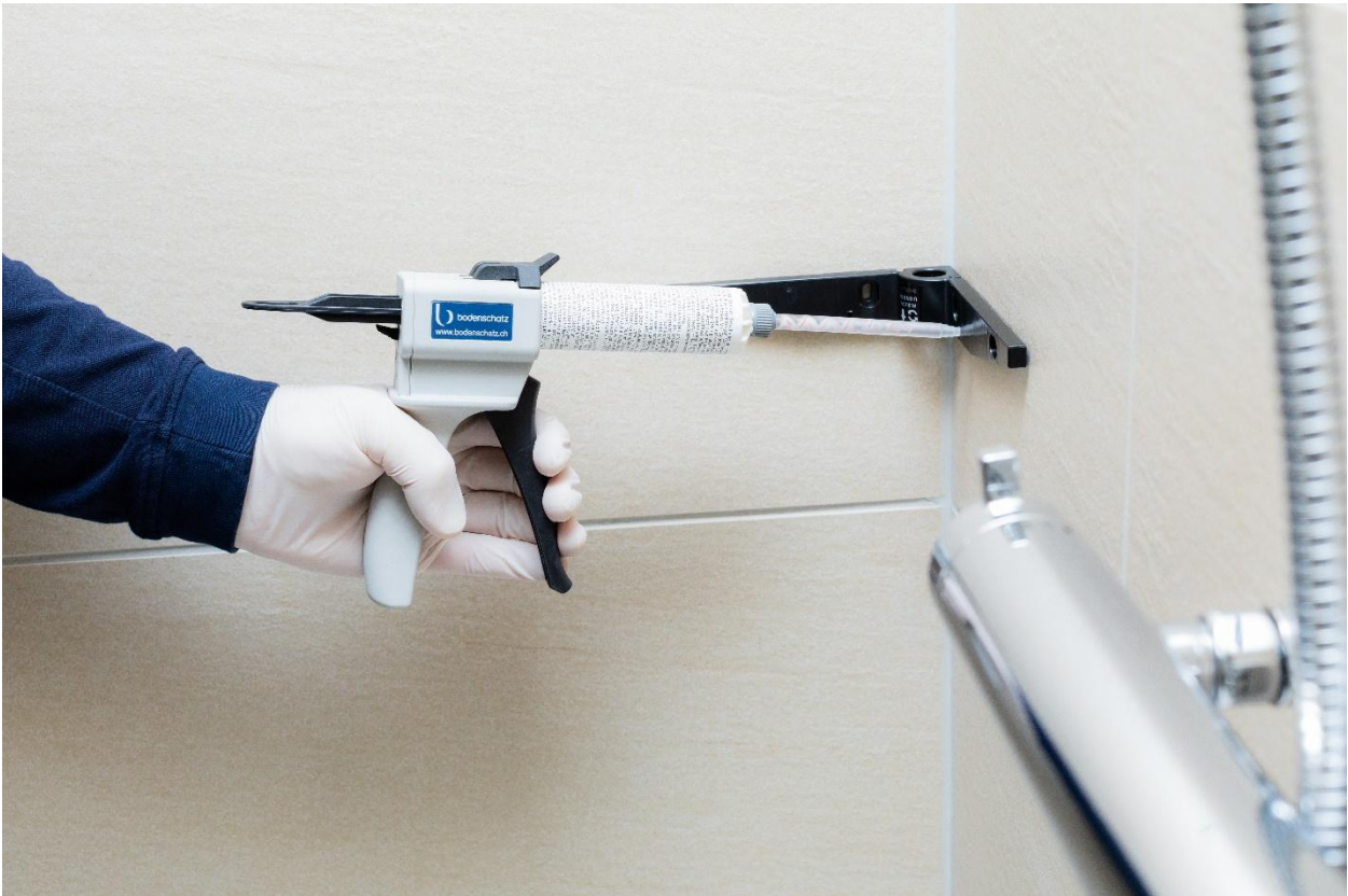
[Bild 1:] Starke Partner: Bodenschutz hat Adesio gemeinsam mit Sika, ZHAW und Branchenpartnern entwickelt und langjährig erprobt.

https://share.mediaflow.com/de/?K0HBJAUX3L